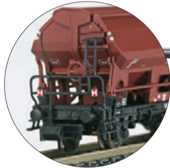
Seitenentladewagen mit Zugschlussscheiben