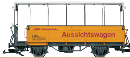
34252 RhB Aussichtswagen