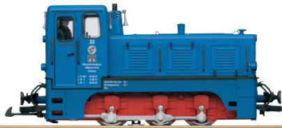
20323 MBB Diesellok V 10C