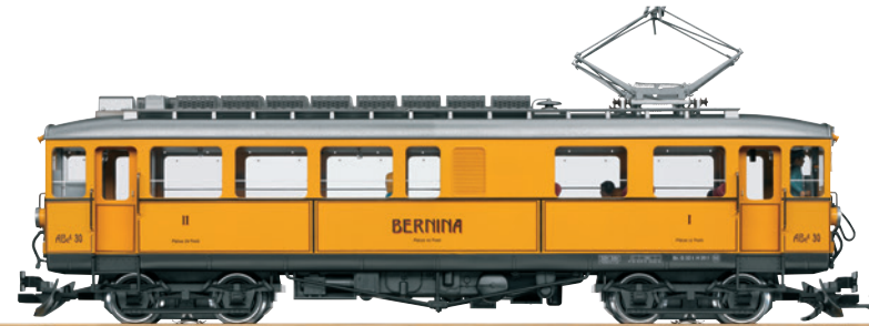
25392 RhB Triebwagen ABe 4/4 30