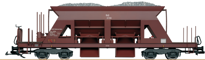
46696 RhB Selbstentladewagen