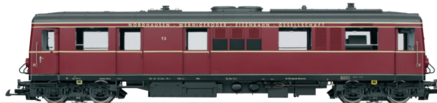
26390 Dieseltriebswagen T3