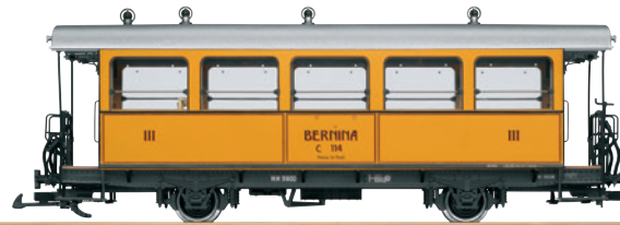
30563 RhB Barwagen C 114