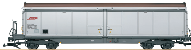
48575 RhB Schiebewandwagen Haik-v