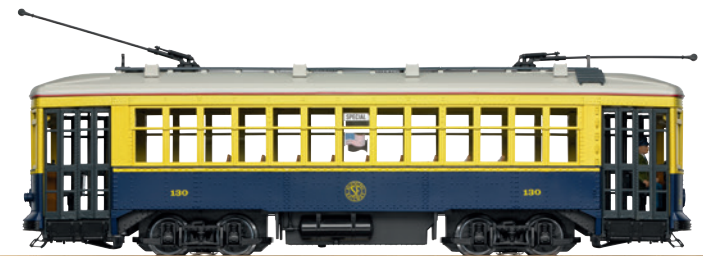
20384 Straßenbahn No. 130 San Francisco