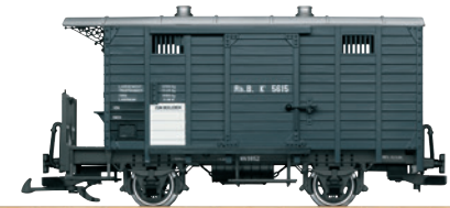
45302 RhB gedeckter Güterwagen